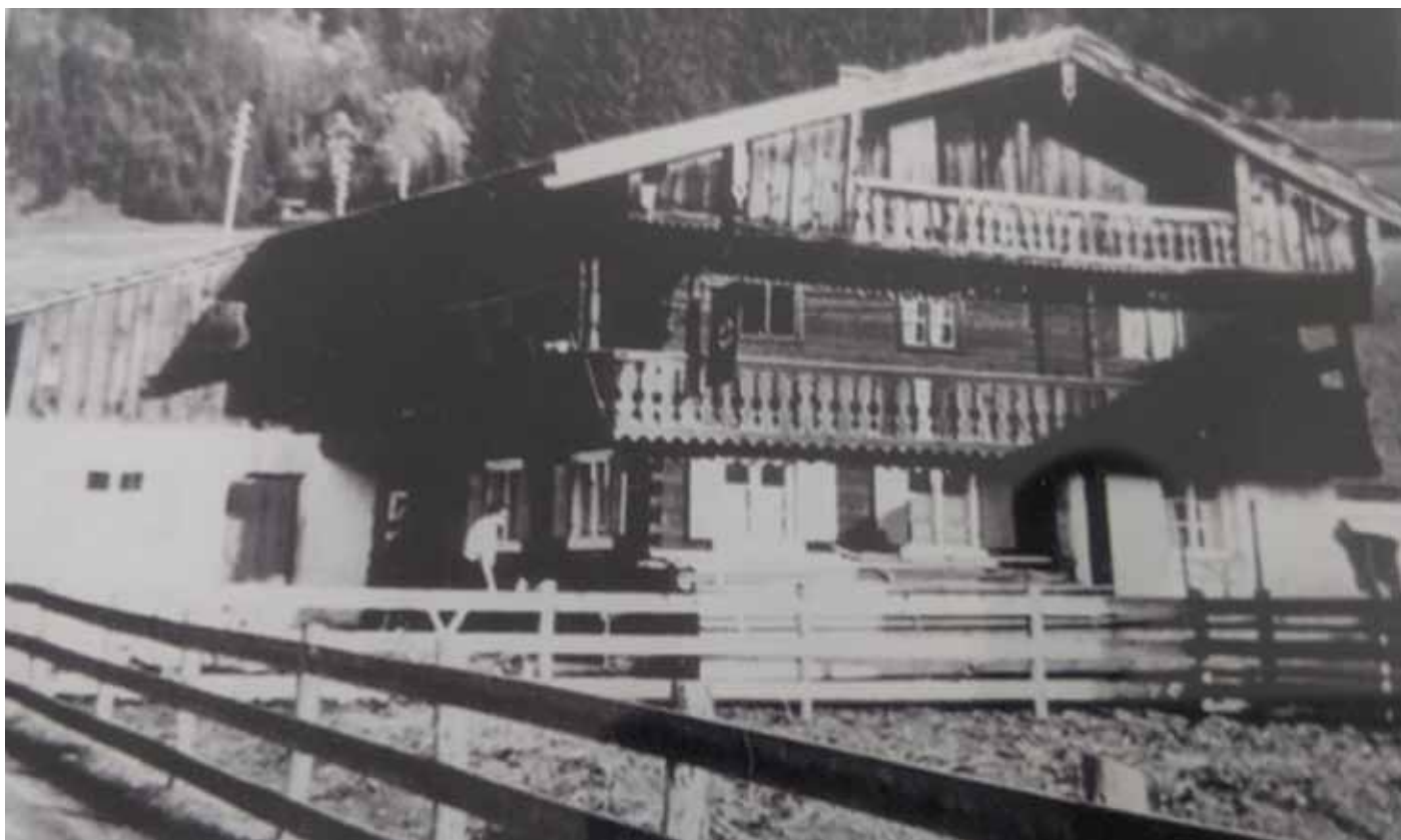
Unsere im Jahr 1939 von Herberts Vater gekaufte Hütte war renovierungsbedürftig – größere Umbauten begannen jedoch erst im Jahr 1957

den Grundstein für den jetzigen Zustand unseres Vereinsheims.