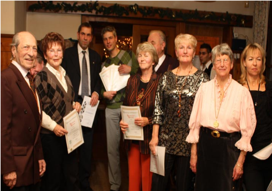
2009 gab es einige Vereins-Jubilare, die auf der Weihnachtsfeier geehrt wurden.