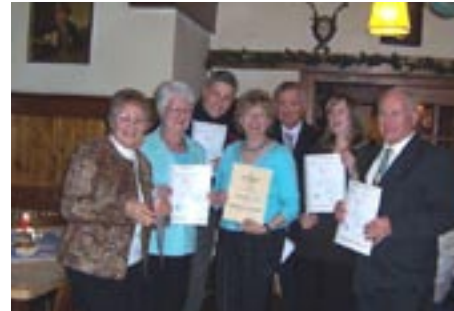
Weihnachtsfeier 2008: viele bekannte, aber diesmal auch einige neue Gesichter.